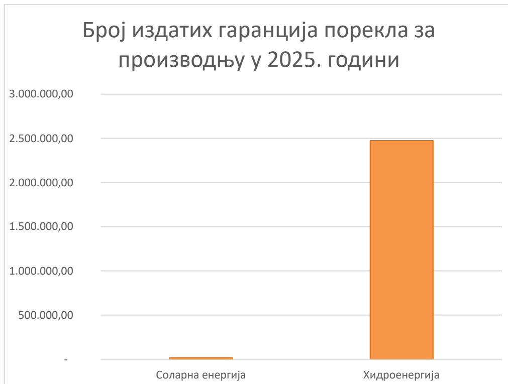
Слика 1 – Издате гаранције порекла за производњу из 2025. године према извору

Више информација о регистрованим учесницима, производним јединицама и броју издатих, пренетих, искоришћених и истеклих гаранција порекла можете пронаћи на јавној интернет страници регистра гаранција порекла на следећем линку: G-REX (grexel.com) .