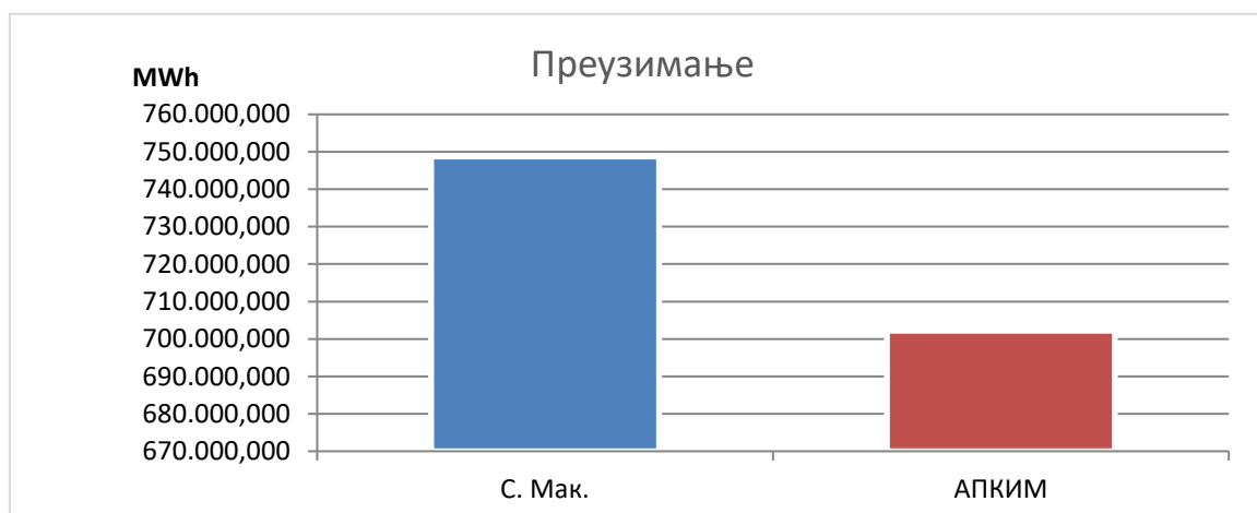
Слика 3 – Размена електричне енергије Републике Србије са трећим областима - преузимање

На следећој слици је приказ размене електричне енергије Републике Србије са трећим областима у 2025. години – смер преузимања електричне енергије: