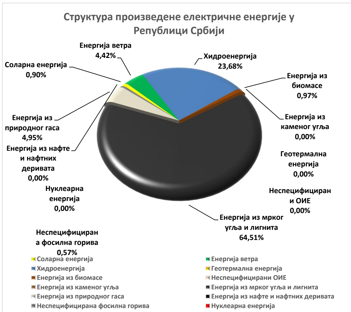
Слика 2 – Структура произведене електричне енергије у Републици Србији

На основу података оператора преносног система, оператора дистрибутивног система, оператора затвореног дистрибутивног система и гарантованог снабдевача, структура произведене електричне енергије у Републици Србији у 2025. години је: