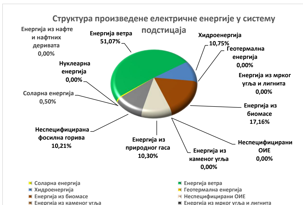
Слика 5 – Структура произведене електричне енергије у систему подстицаја у 2025. години

Гарантовани снабдевач утврђује и јавно објављује на својој интернет страници извештај о количинама и структури електричне енергије произведене у систему подстицаја до краја фебруара текуће године, за претходну календарску годину.