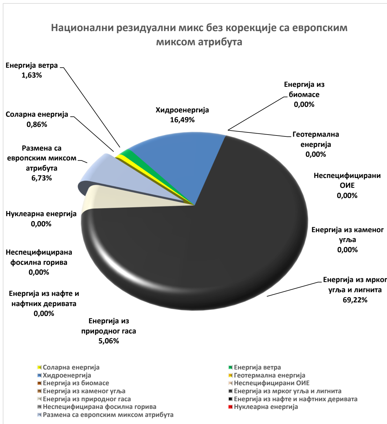
Слика 6 – Национални резидуални микс електричне енергије без корекције са европским миксом атрибута за 2025. годину