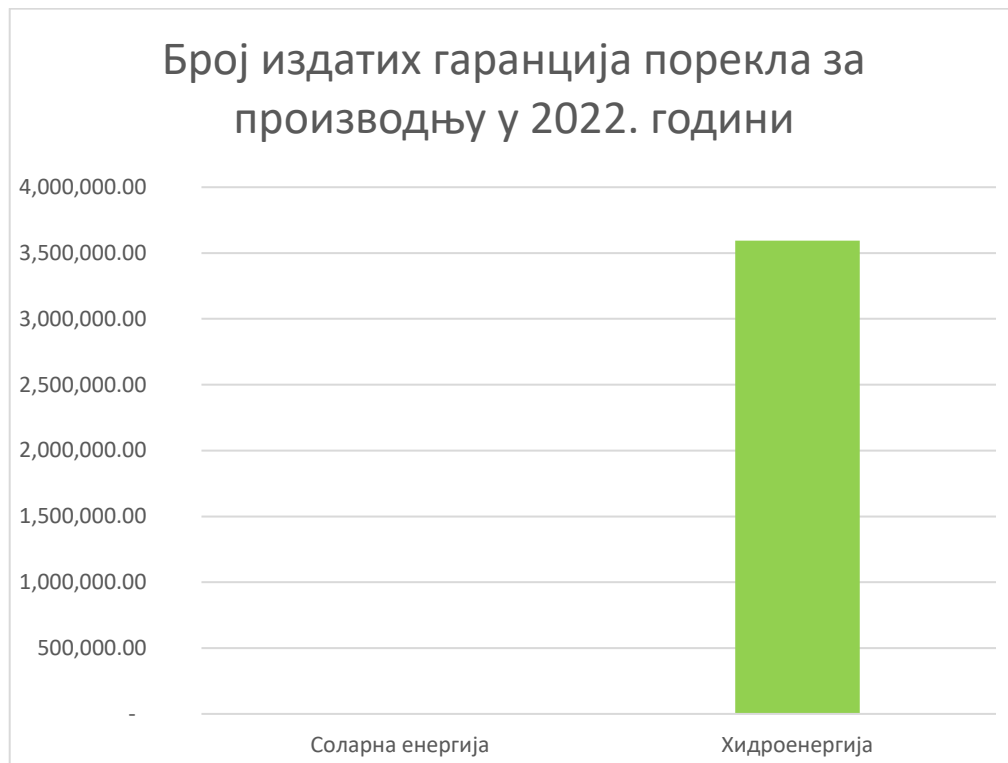
Слика 1 – Издате гаранције порекла за производњу из 2022. године према извору

Више информација о регистрованим учесницима, производним јединицама и броју издатих, пренетих, искоришћених и истеклих гаранција порекла можете пронаћи на јавној интернет страници регистра гаранција порекла на следећем линку: G-REX (grexel.com) .