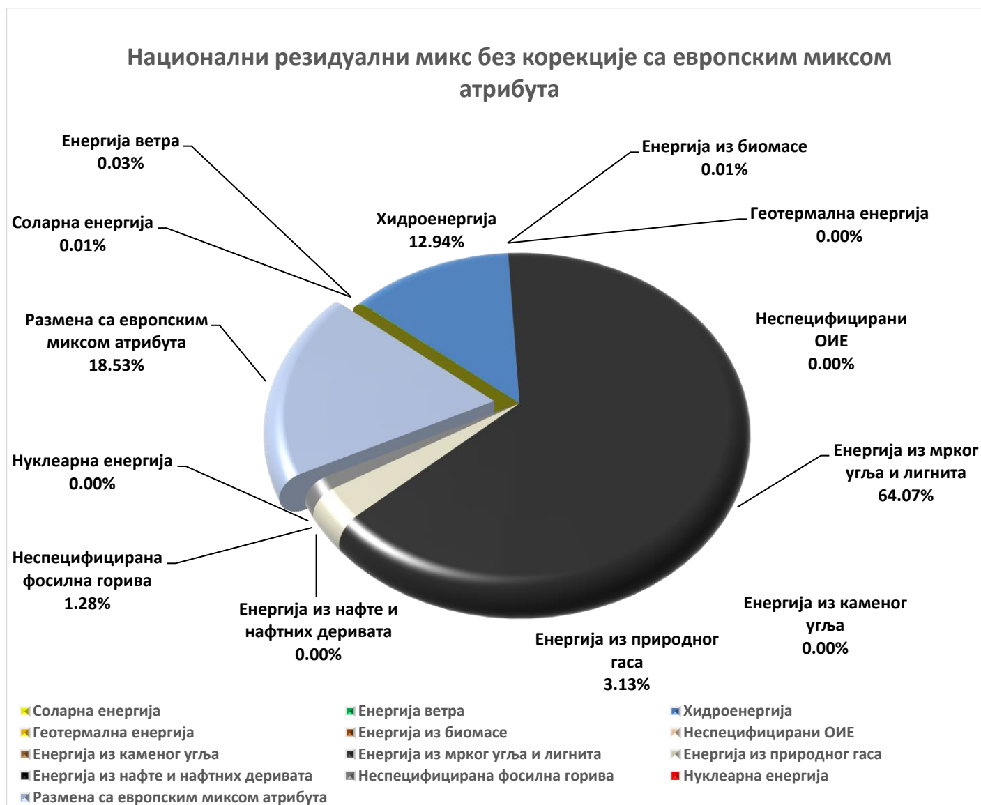
Слика 6 – Национални резидуални микс електричне енергије без корекције са европским миксом атрибута за 2022. годину