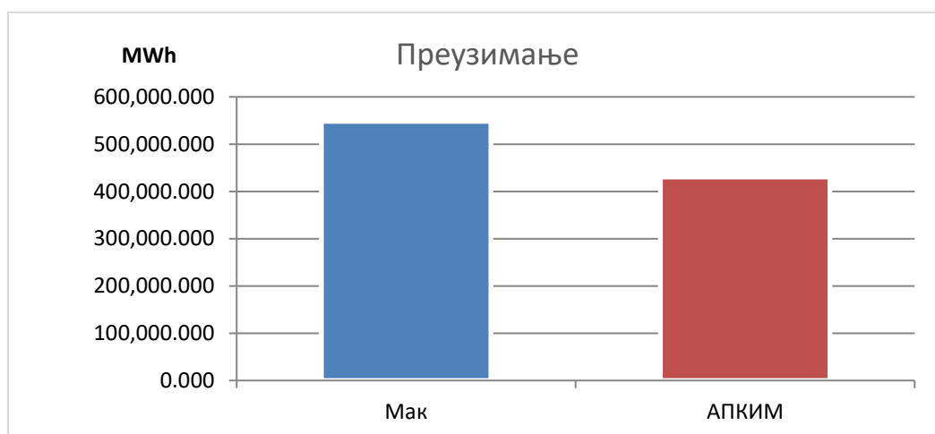
Слика 3 – Размена електричне енергије Републике Србије са трећим областима - преузимање

На следећој слици је приказ размене електричне енергије Републике Србије са трећим областима у 2022. години – смер преузимања електричне енергије: