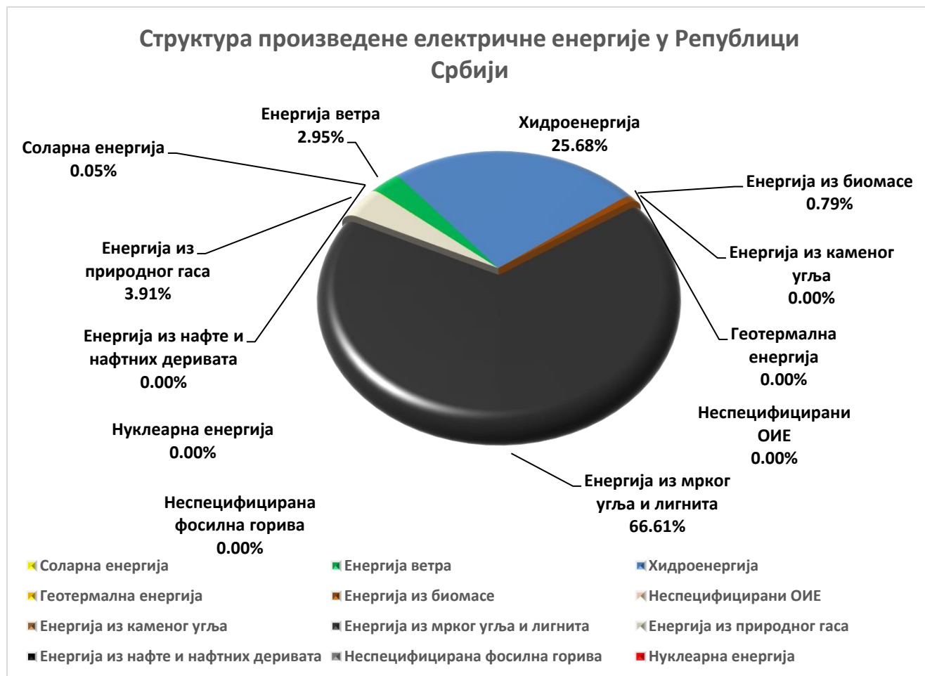
Слика 2 – Структура произведене електричне енергије у Републици Србији

На основу података оператора преносног система, оператора дистрибутивног система, оператора затвореног дистрибутивног система и гарантованог снабдевача, структура произведене електричне енергије у Републици Србији у 2022. години је: