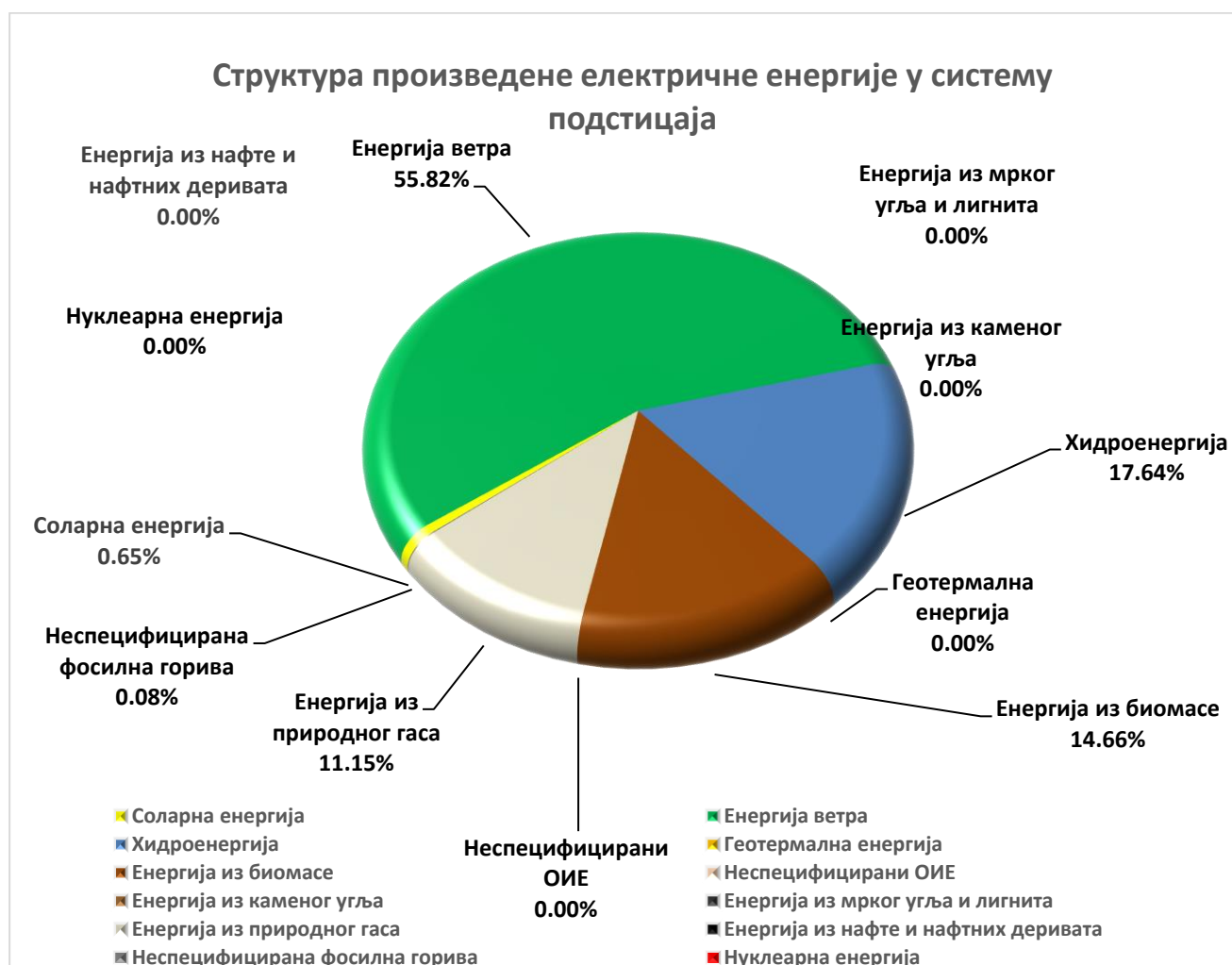
Слика 5 – Структура произведене електричне енергије у систему подстицаја у 2022. години

Гарантовани снабдевач утврђује и јавно објављује на својој интернет страници извештај о количинама и структури електричне енергије произведене у систему подстицаја до краја фебруара текуће године, за претходну календарску годину.